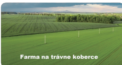
Farma na trávne koberce